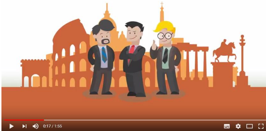
Seminario formativo strumenti finanziari UE

Il seminario è strutturato in quattro sessioni formative nelle quali sono ripartite le principali tematiche nell'utilizzo degli strumenti finanziari nell'ambito dei Fondi strutturali e di investimento europei (Fondi SIE) con i quali sono cofinanziati fondi per prestiti e per micro-prestiti, fondi di garanzia e veri e propri fondi rischi, fondi di partecipazione al capitale di rischio, contributi in conto interessi ed altri aiuti pubblici riferibili alle amministrazioni centrali e regionali. I principali temi affrontati riguarderanno le fonti informative sulle regole e sulle opportunità, i requisiti richiesti agli intermediari finanziari, i vincoli normativi (ad esempio sulle condizioni di ammissibilità delle imprese prenditrici), gli oneri relativi al monitoraggio degli strumenti, i controlli di primo e secondo livello, gli adempimenti relativi al registro nazionale degli aiuti di Stato.